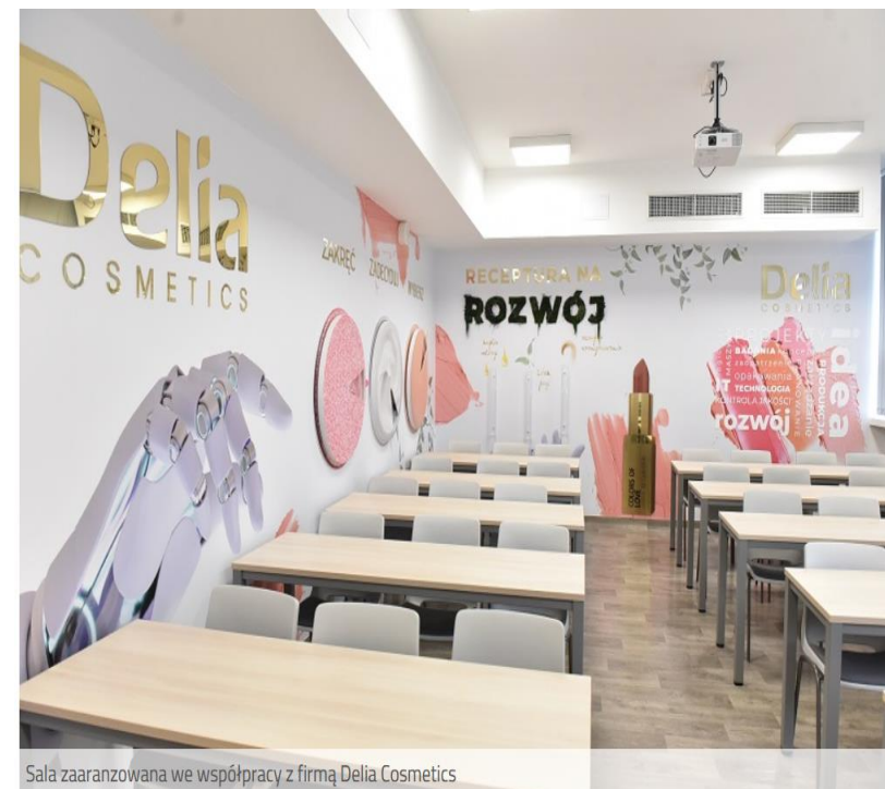
Sala zaaranżowana we współpracy z firmą Delia Cosmetics